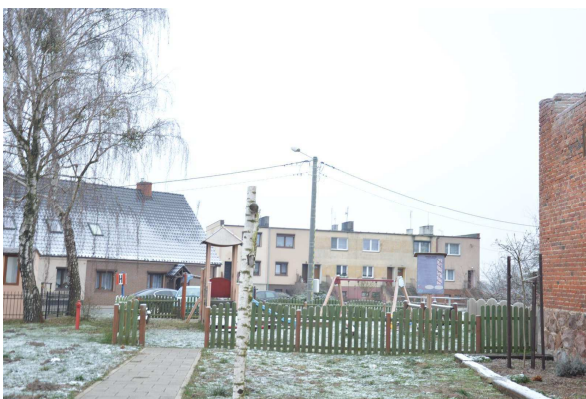
Plac zabaw w Dębnie