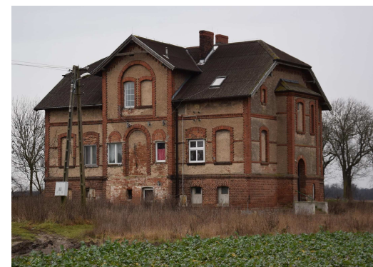
Pałac w Szymanowie (mieszkania komunalne)