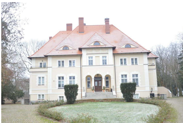
Pałac w Dębnie

Sporządzili: Anna Wiczorek, Krzysztof Pacholak