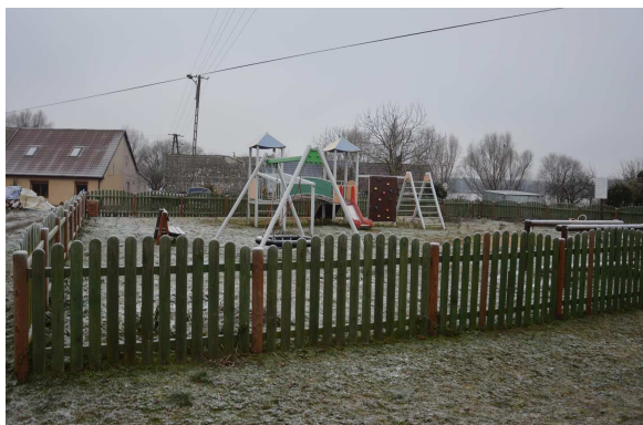
Plac zabaw w Buszewku