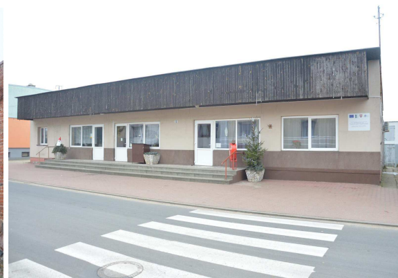
Świetlica wiejska w Dębnie