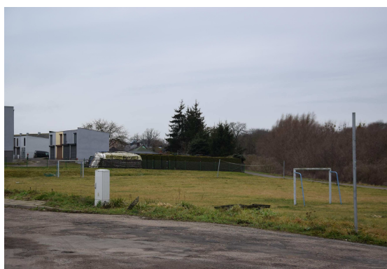
Boisko w Buszewku